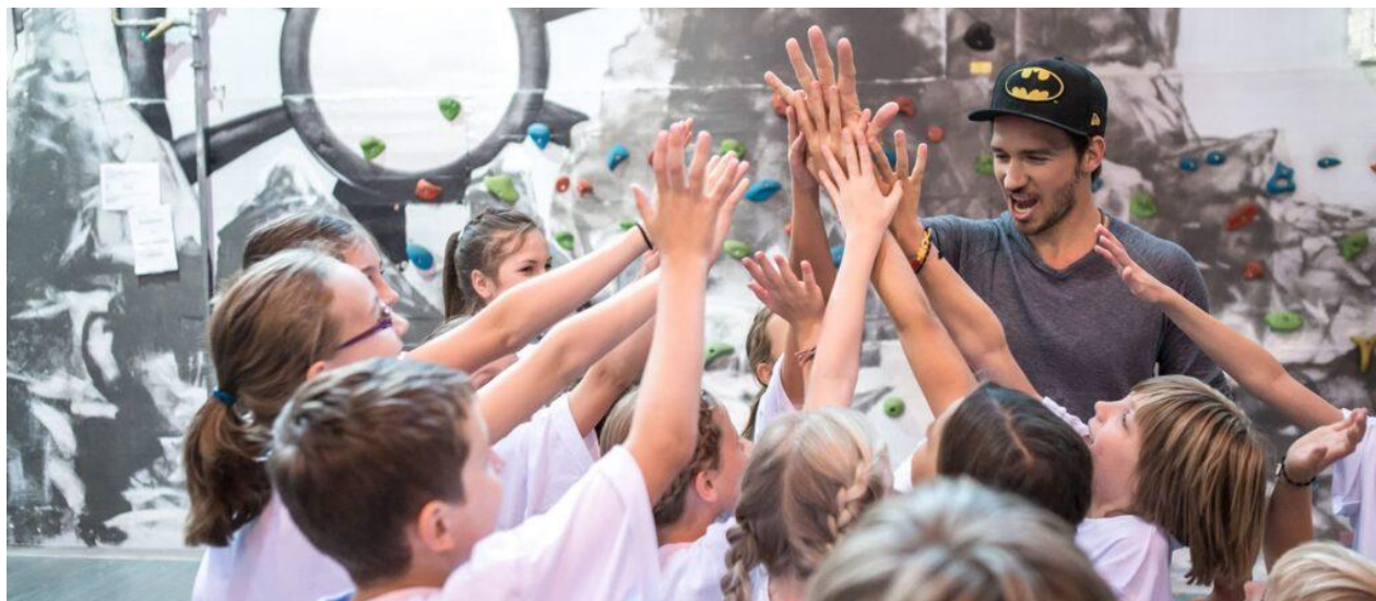
Beweg Dich schlau! Championships – Vereins- & Schulcoach Ausbildung – mehr auf Seite 2