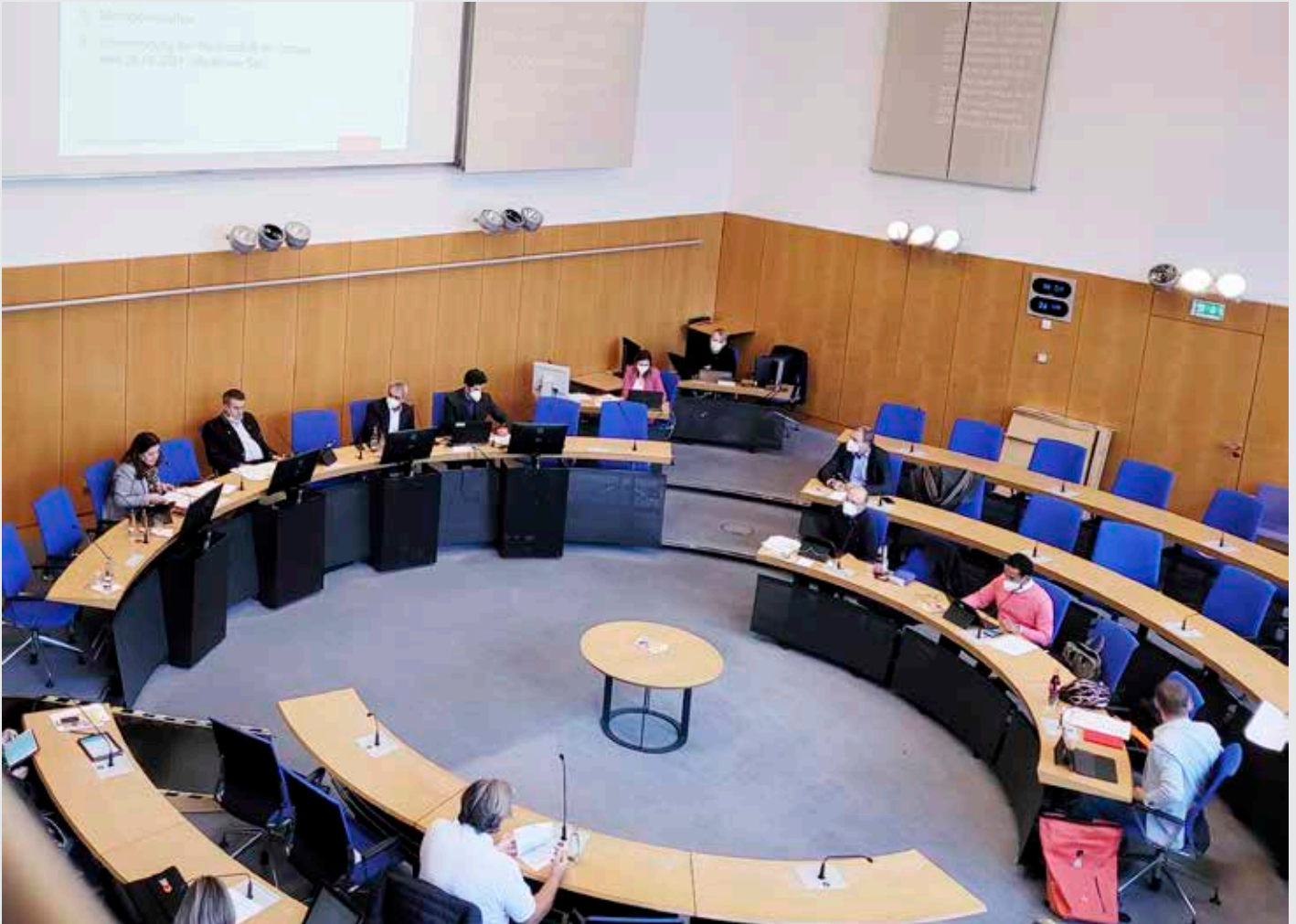
Sportkommission am 26.11.2021

die Stadt zieht mit ihren Sportvereinen weiter an einem Strang