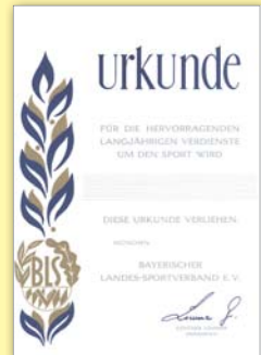
Urkunde in Bronze