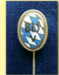
Verdienstnadel in Gold