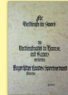
Urkunde Verdienstnadel in Bronze mit Kranz

Der BLSV verleiht die Verdienstnadel in Bronze, Bronze mit Kranz, Silber, Silber mit Gold, Gold mit Kranz, Gold mit großem Kranz, und Gold mit Brillanten, Gold mit Brillanten und Kranz, Gold mit Brillanten und großen Kranz, jeweils mit Urkunde, an Mitarbeiter in der Vereinsvorstandschaft.