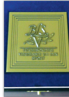
Verdienstplakette in Bronze