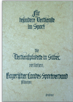
Urkunde für Verdienstplakette in Silber

an Verbandsangehörige sowie an außerhalb stehende Persönlichkeiten, die sich durch ideelle oder materielle Förderung des Sports besonders verdient gemacht haben.