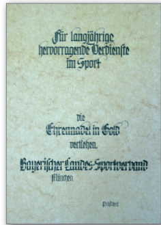
Urkunde für Ehrennadel in Gold

Bronze, Silber, Silber mit Gold, Gold, Gold mit Kranz, Gold mit großem Kranz, Gold mit silbernem Lorbeerblatt, Gold mit goldenem Lorbeerblatt, Gold mit Brillanten, Platin und Platin mit Brillanten jeweils mit Urkunde, an Mitarbeiter des Verbandes und seiner Gliederungen.