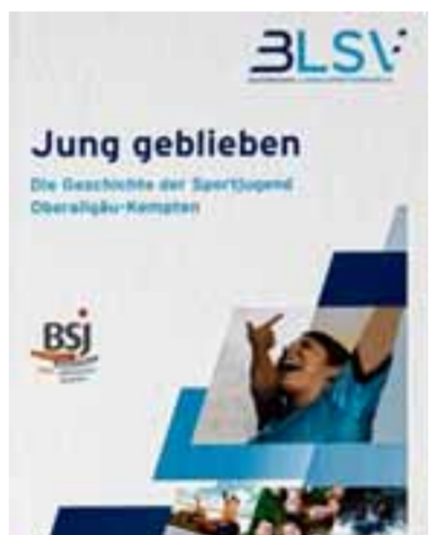
So sieht die neue BLSV-Chronik über den Jugendsport aus.