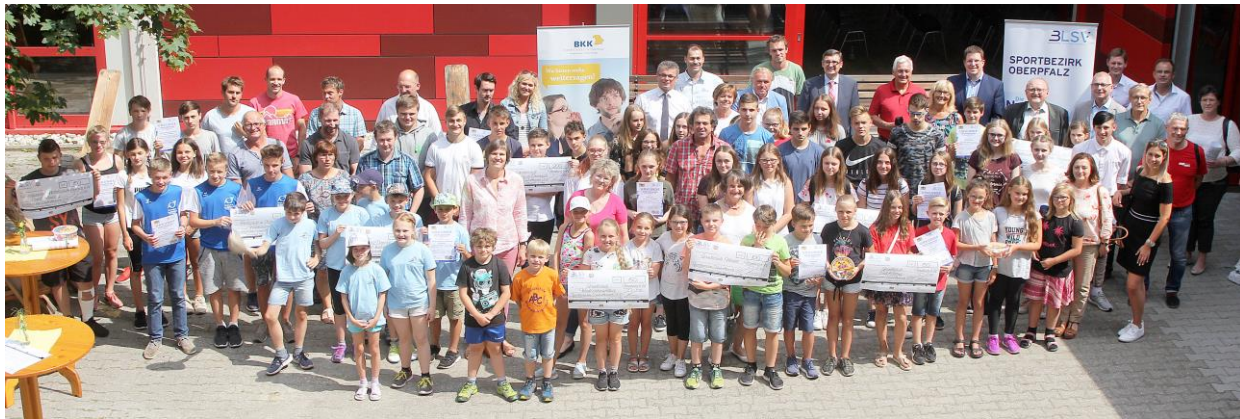
Die Siegerschulen am Sportabzeichen-Schulwettbewerb (mehr auf Seite 2)