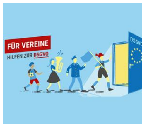
Illustration: Bayerisches Staatsministerium des Innern und für Integration

Nützliche Mustervorlagen und einen umfassenden Fragen-Antworten-Katalog (FAQ) finden die BLSV-Vereine in ihrem persönlichen Vereinszugang im BLSV-Cockpit unter cockpit.blsv.de ■