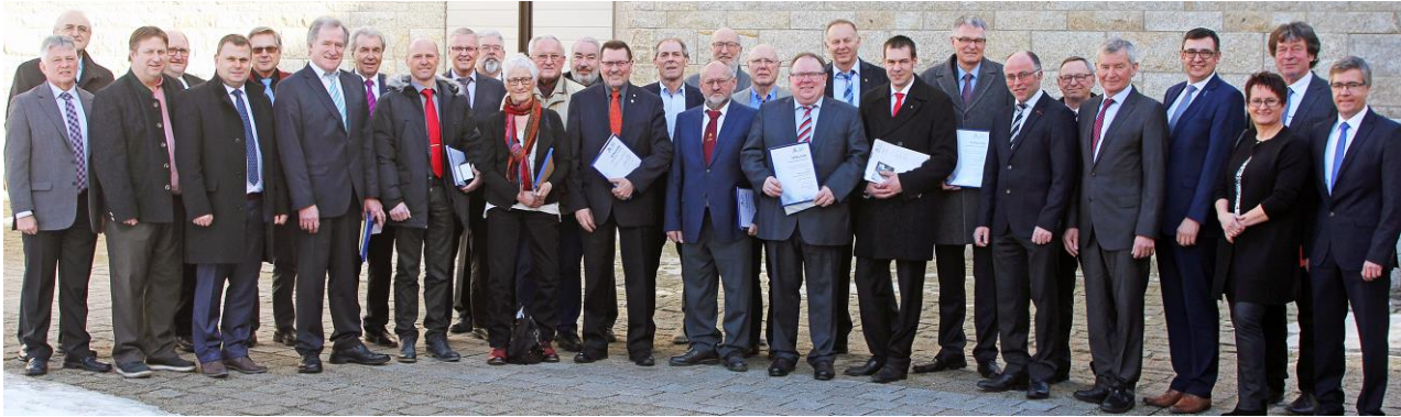
Verleihung des BLSV-Ehrenamtspreis Oberpfalz – mehr auf Seite 2