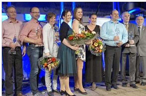
Die Preisträger der diesjährigen Ehrung der besten Sportler Niederbayerns