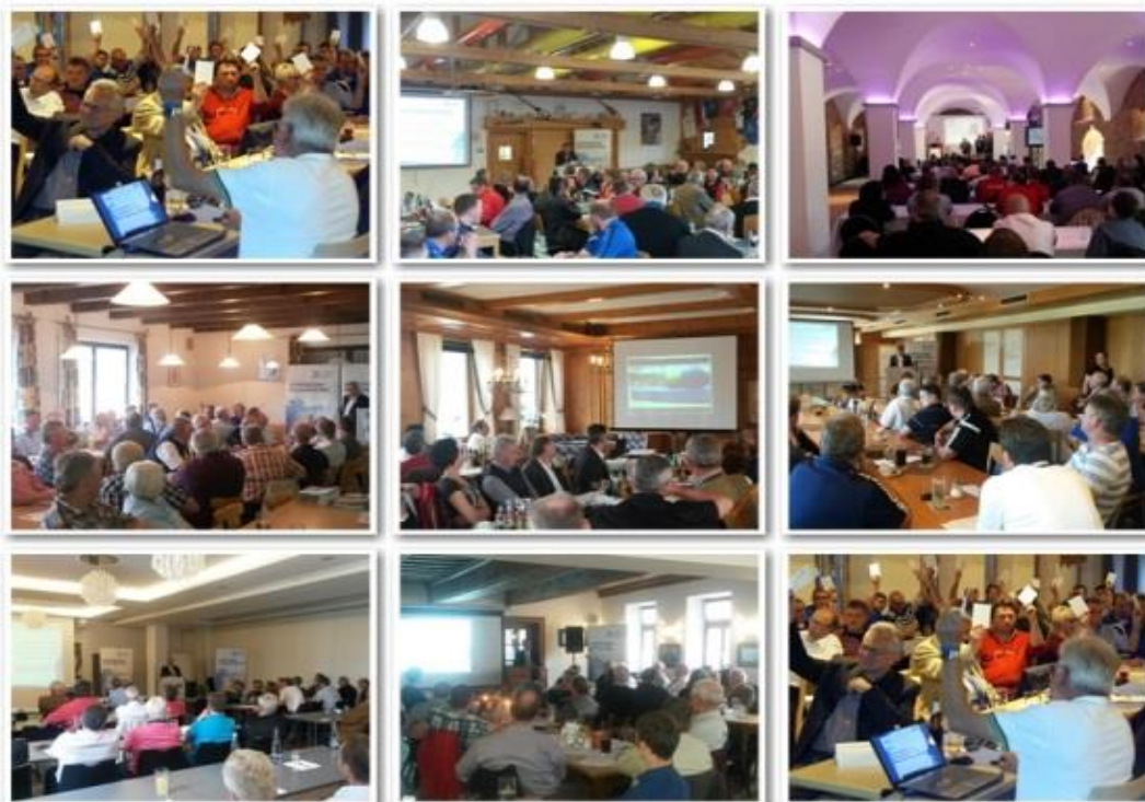
Gut besucht waren die außerordentlichen Kreistage in den neun niederbayerischen Sportkreisen

Im Sportbezirk Niederbayern haben acht von neun außerordentlichen Kreistagen bereits stattgefunden, lediglich der Sportkreis Landshut folgt noch am 22. Juli. Alle Vereine des jeweiligen Sportkreises wurden hierzu per Einschreiben schriftlich eingeladen und konnten sich aus erster Hand mit einem Referat eines BLSV-Präsidiumsmitglieds über die Leistungen des BLSV für die Vereine und den neuen Verteilerschlüssel informieren. Die anwesenden Vereinsvertreter zeigten sich dabei durchaus beeindruckt von der Vielfalt der Leistungen, die der BLSV den Vereinen bietet und nicht wenige nutzten auch gleich die Gelegenheit, sich mit dem anwesenden BLSV-Präsidiumsmitglied auszutauschen. Bei den außerordentlichen Kreistagen wurden neben den Delegierten zum Verbandstag im November auch Delegierte für einen möglichen außerordentlichen Bezirkstag am 24. September in Deggendorf gewählt. Ob dieser letztendlich stattfinden wird, entscheidet sich allerdings erst kurzfristig, da dieser nur stattfinden muss, wenn von den gewählten Delegierten fristgerecht Anträge eingereicht werden.