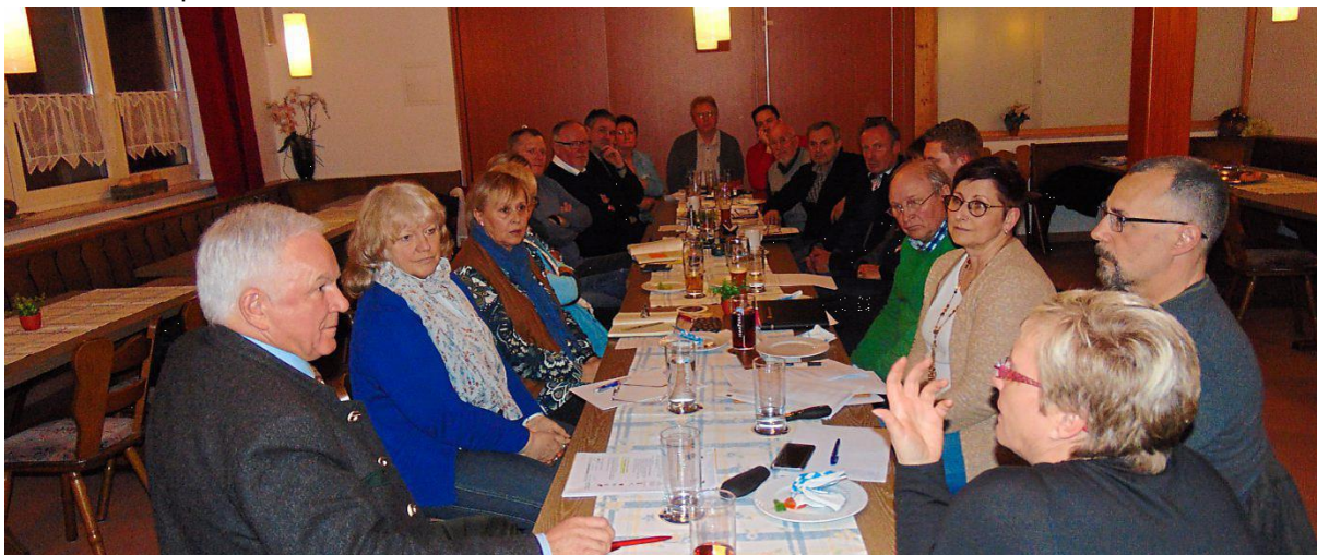
„Der Sonntag muss der Familie und dem Sport vorbehalten bleiben“ lautet eine der Forderungen der Allianz für den freien Sonntag