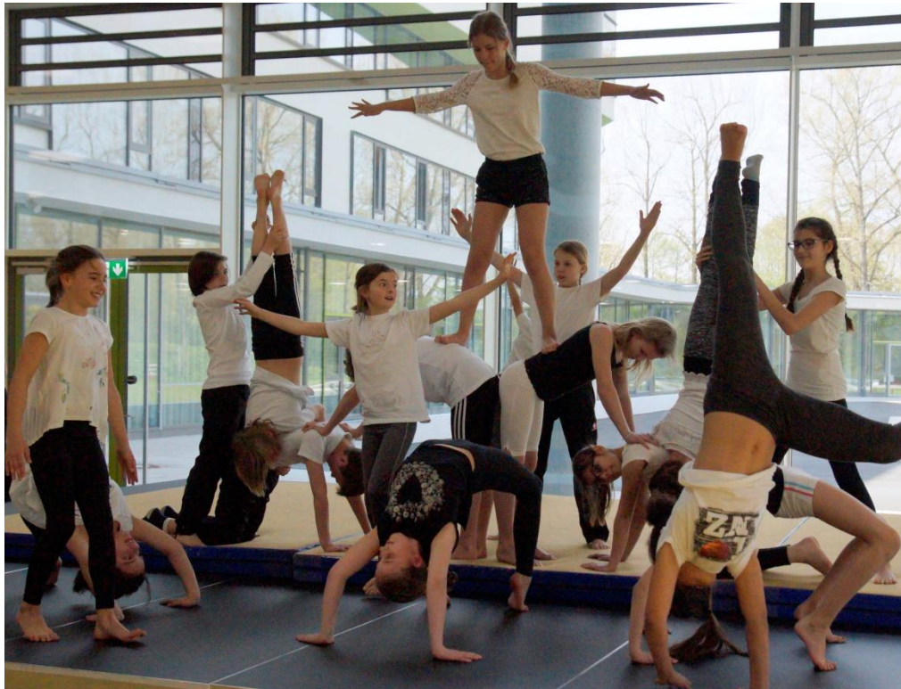
Eine sehr gelungene akrobatische Vorführung boten die Gymnasiastinnen aus Ergolding.