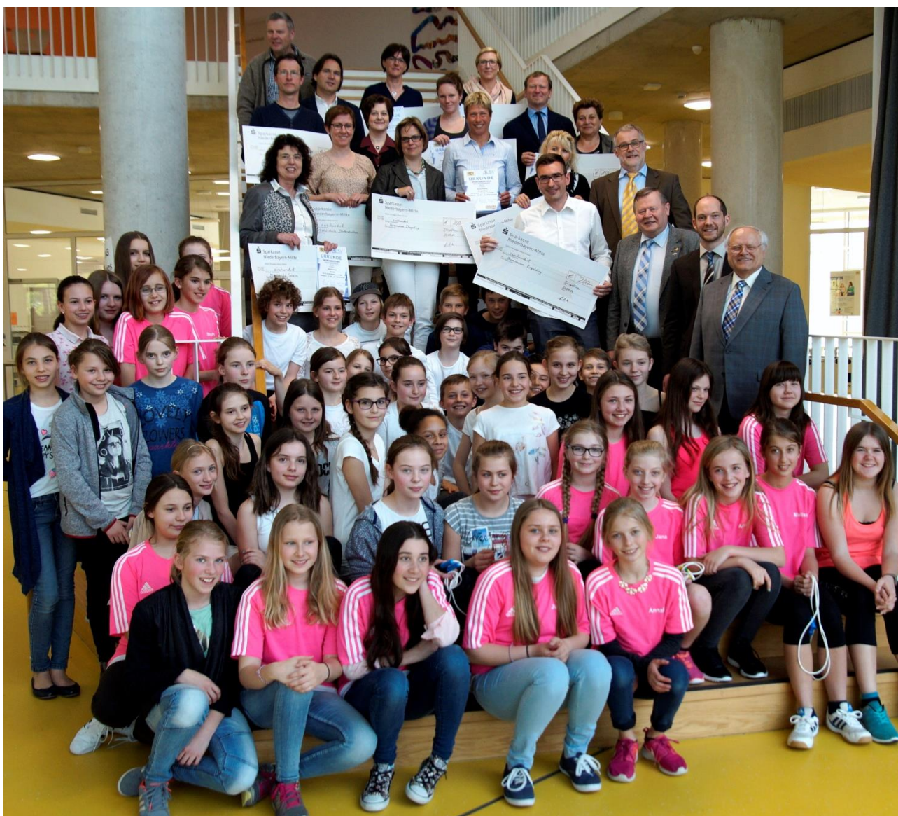
Schlussbild mit bei der Siegerehrung in der Aula des Gymnasiums Ergolding

Knüpft der Sportabzeichen-Schulwettbewerb im BLSV-Bezirk Niederbayern wieder an „frühere Zeiten“ an, als im Jahr 2009 bei 179 teilnehmenden Schulen deutlich über 10 000 abgelegte Sportabzeichen gab? Im Wettbewerbsjahr 2014/2015 nahmen die teilnehmenden Schulen (plus sechs auf 98) zwar leicht zu, die abgelegten Abzeichen reduzierten sich allerdings auf 6.841. „Leuchtendes Beispiel“ bei der Siegerehrung im Gymnasium Ergolding war die Mittelschule Jandelsbrunn, die sich im Bezirk Niederbayern und auf Landesebene mit 93 Abzeichen (von 130 Schülern) zum dritten Mal hintereinander Platz 1 holte. Weitere Stockerplätze sicherten sich auf Landesebene die Adalbert-Stifter-Mittelschule Wegscheid (61 von 102 Schülern/2.) und das gastgebende Gymnasium Ergolding (205 von 311/3.).