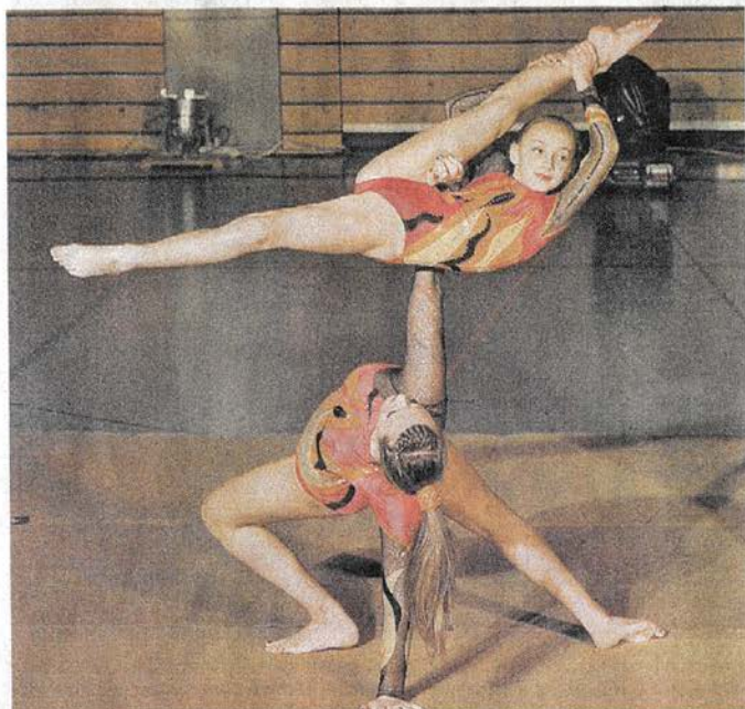
Verdrehte Sache: Bei der Sportgala gab es allerhand spektakuläre Darbietungen zu sehen – so auch von diesen beiden Weißenburger Sportakrobatinnen.

Bandbreite reichte von Aerobic über eine Flugshow und Fechten bis hin zu Zumba – 300 Mitwirkende