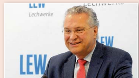
Wieder Schirmherr der Veranstaltung: Bayerns Sport- und Bauminister Joachim Herrmann.