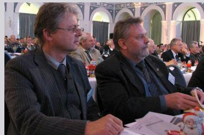
3. Mitgliederversammlung des DOSB 2007 in Hamburg